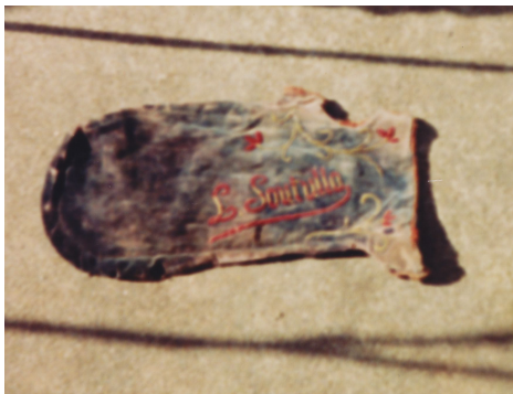
Fig.27 - (Φ) Vestido personalizado do fol da gaita de Luís Soutullo.