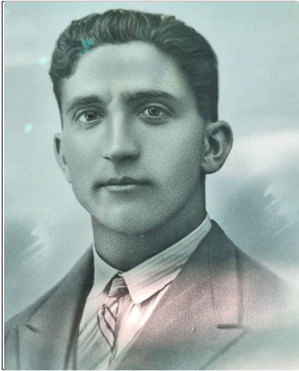
Fig. 15 - Luís Soutullo Iglesias. Lira, 1931.