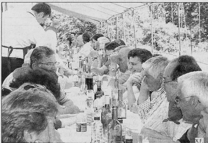
A la celebración acudieron más de 300 personas.